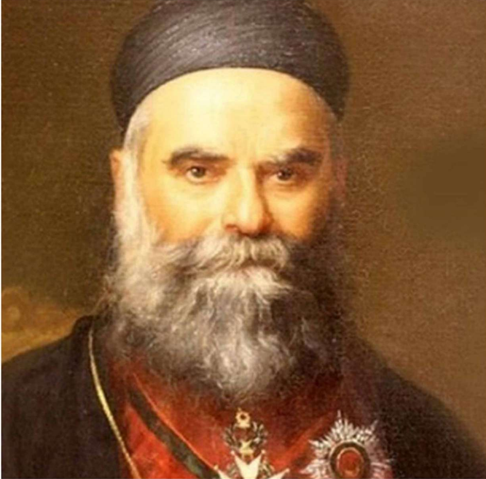
حمل البطريرك الحويك تصورًا متكاملًا للبنان

الحديثة، وأحد الشخصيات الأربع التي يُجمع المؤرخون اللبنانيون على اعتبارها الركائز المؤسسة للبنان، إلى جانب الأمير فخر الدين المعني الثاني، والأمير بشير الثاني الشهابي، ويوسف بك كرم. تكتسب هذه الخطوة أهميتها من التوقيت السياسي والتاريخي الذي تأتي فيه، إذ إن إعلان تطويب الحويك، إذ يُقرأ بوصفه تكريمًا دينيًا لرجل كرس حياته للخدمة الروحية والاجتماعية فحسب، إلا أن الأهم هو إعادة استحضار رمزي لفكرة لبنان نفسها، في لحظة تبدو فيها هذه الفكرة مهددة أكثر من أي وقت مضى منذ إعلان دولة لبنان الكبير عام 1920. فالرجل الذي خاض معارك دبلوماسية وسياسية في المحافل الدولية عقب الحرب العالمية الأولى، وساهم في تثبيت حدود لبنان الكبير وانتزاع الاعتراف الدولي به، يعود اليوم إلى المشهد اللبناني من بوابة القداسة، بينما يواجه لبنان أخطر أزماته الوجودية، مع تحوّل البلاد إلى ساحة مفتوحة لتصفية الحسابات الإقليمية والدولية. وتشير القراءة التاريخية لمسيرة الحويك إلى أنه لم يكن معنيًا فقط